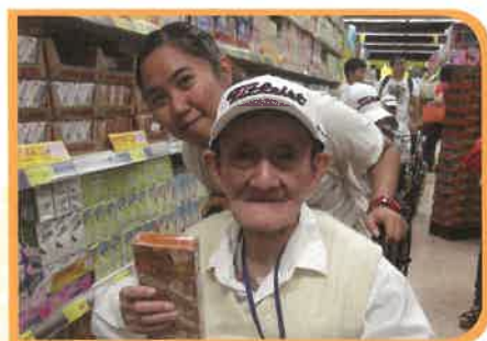
有得行超市、買小食，真是一樂也！