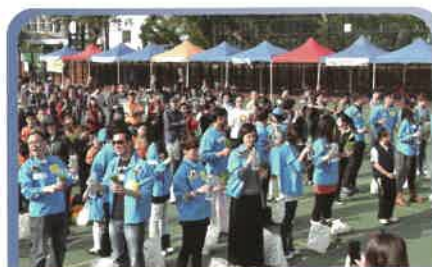
愛回家眾演藝人員到場參與支持是次撐傘活動