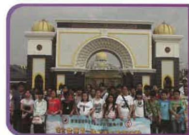
「馬來西亞學習團」讓同學有機會親身接觸中國以外的文化、生活習慣及名勝古蹟。