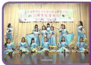
芭蕾舞組的同學於舞台上跳出優美的舞步。