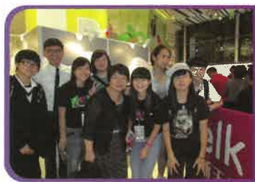
「青年製造－抱抱社區成果展」，推動社區參與，宣揚共融關愛。