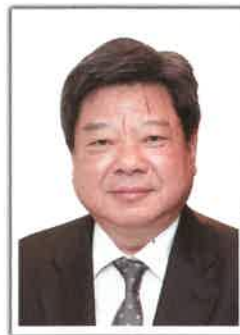
副主席 鄧錦雄博士MH