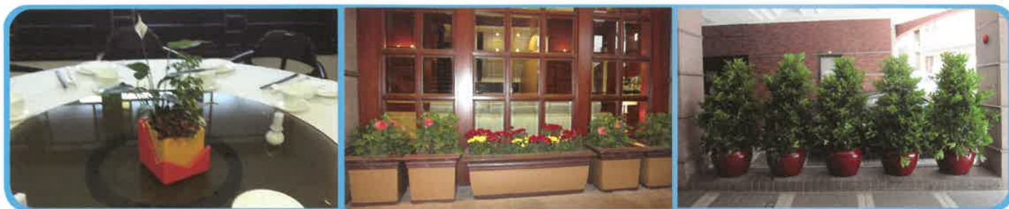
香港英皇駿景酒店