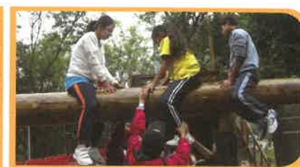
「成長的天空」的挑戰活動有助學生增強抗逆能力。