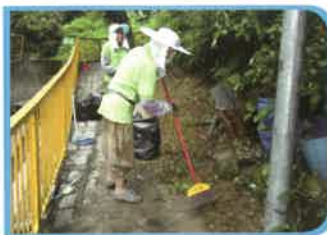
承辦民政署鄉郊清潔計劃