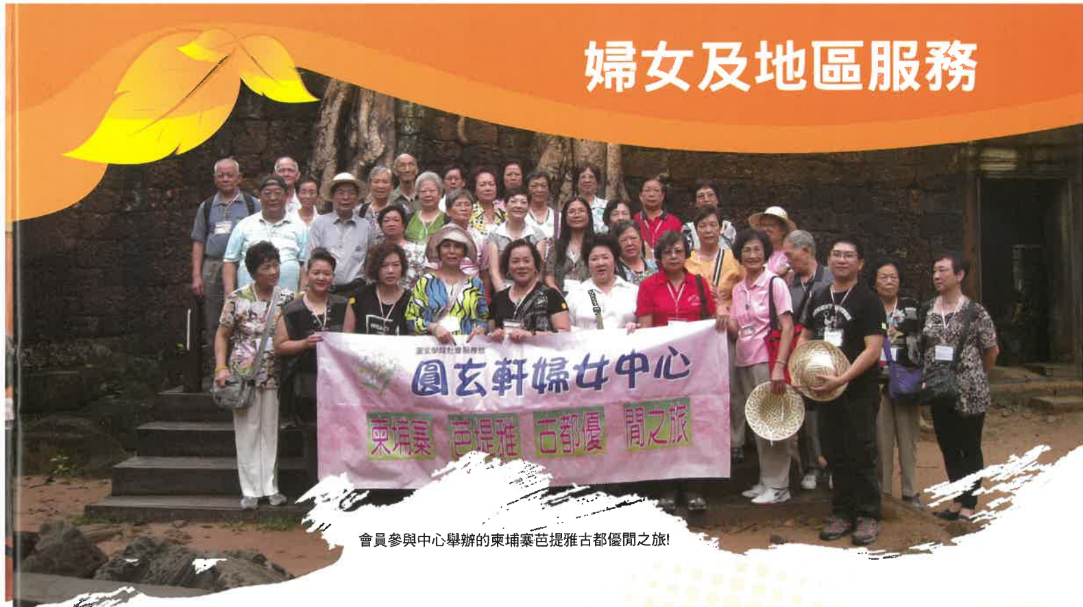
會員參與中心舉辦的東埔寨芭提雅古都優閒之旅!