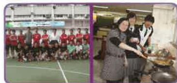
創造愉快校園生活，提供多元 化活動經歷