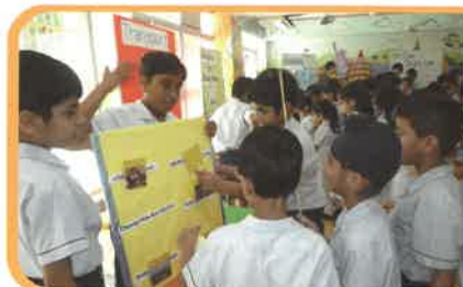
南亞裔學生正參與「成長的天空」校園服務-攤位活動