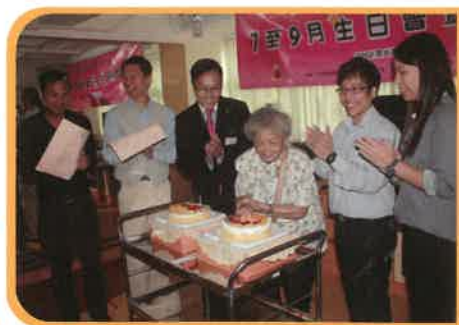
金鐘獅子會與長者 共慶生日會及賀中秋