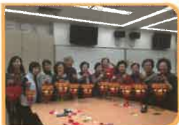
透過廢物利用，製作新春環保掛飾。