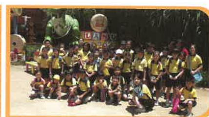
學生最喜愛的暑期活動，莫過於暢玩迪士尼了。