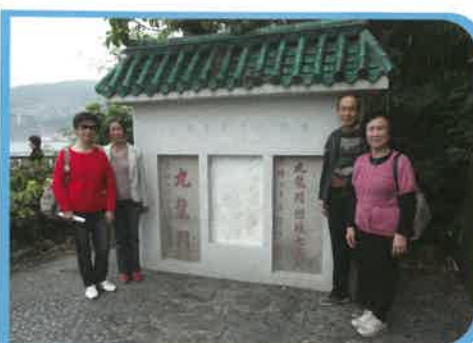
九龍關碑石及「九龍關借地七英尺」