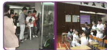
看清前路，訂定目標；跨越 向前，理想達到