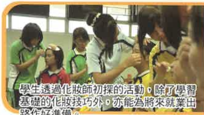
學生透過化妝師初探的活動，除了學習基礎的化妝技巧外，亦能為將來就業出路作好準備。