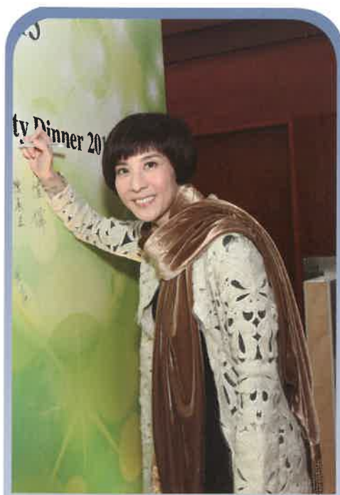
林漪琪小姐對慈善活動鼎力支持