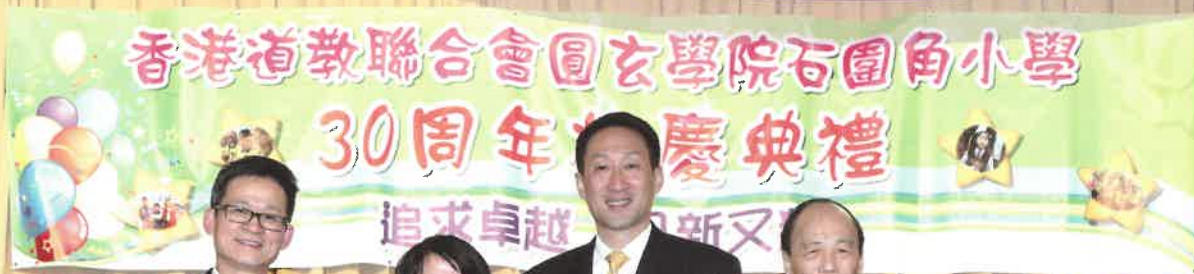
修畢博士課程的校友回來一同慶賀母校三十周年。