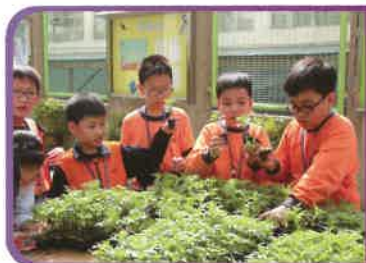
“一人一花活動”：今年的主題花是萬壽菊，同學們都踴躍參與

本校透過推行各種不同的活動，幫助學生健康成長，為學生提供不同的學習經歷，讓學生得到全面的發展，並得到廣泛的好評，榮獲「健康校園獎勵計劃」金獎及「第十屆香港綠色學校獎」。