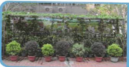
仁濟醫院嚴徐玉 珊幼稚園