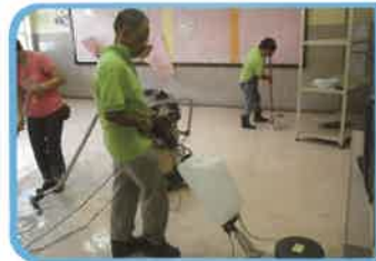
承辦學校清潔工程