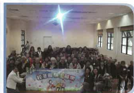
長者及家屬參與生死教育日營，鼓勵長者積極為自己的生活作出準備。！