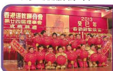
高班學生於「2013癸巳年春節聯歡晚宴」中表演燈籠舞