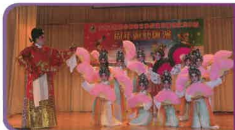
今年，粵劇組的同學為我們表演「蝶影紅梨記」