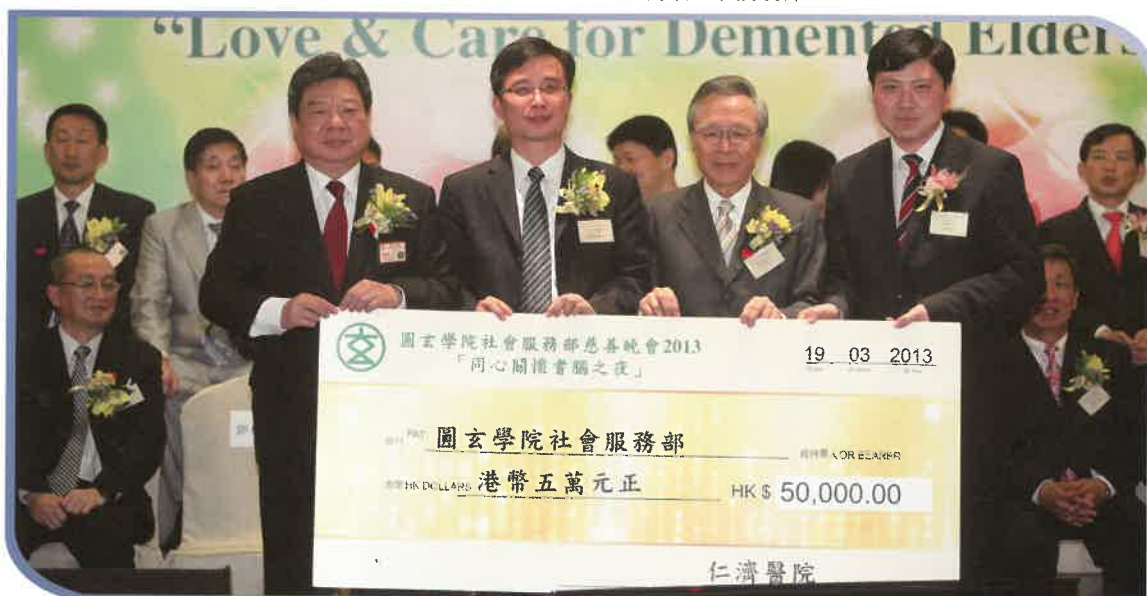
仁濟醫院捐出5萬元獲明珠贊助美譽