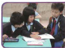
伴讀大使正在協助同學朗讀課文，糾正發音，鞏固所學。