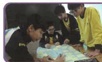
同學們專注地進行專題研習。