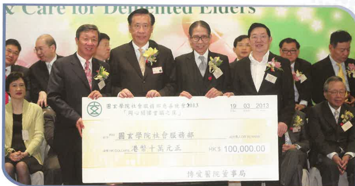
博愛醫院慷慨贊助10萬元成為翡翠贊助，支持晚會