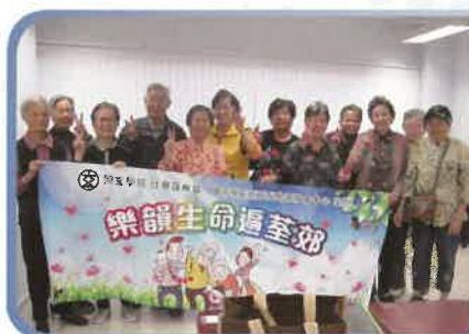
長者參與生命回顧小組。

計劃由社會福利署贊助，於二零一二至二零一三年期間於荃灣郊區進行。透過一系列活動向市民大眾宣揚預防虐老及生命教育訊息。同時，與長者回顧人生經歷的階段，總結過去，讓他們抱正面及欣賞的角度肯定自己，並致力鼓勵他們積極為自己的生活作出準備。計劃同時鼓勵長者以欣賞及正面態度面對人生的終結，並以開放接納的態度面對死亡，以平安感恩的心情享受生命，為死亡作預備，使人生歷程更臻圓滿。