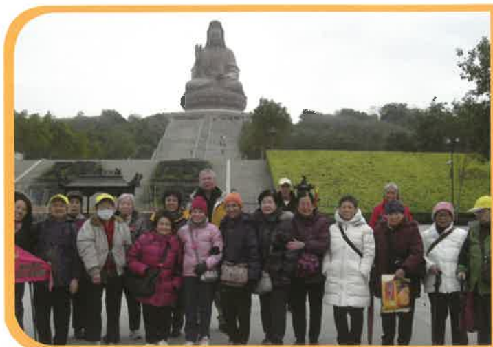
會員興高采烈參加新春西樵山兩天旅行，祈求大家龍精虎猛。