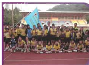
參加2012-13年度荃灣區小學校際運動會的健兒