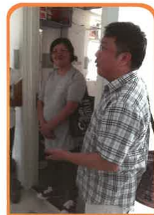
互惠社委員和義工到訪一戶單親家庭，了解其生活狀況。