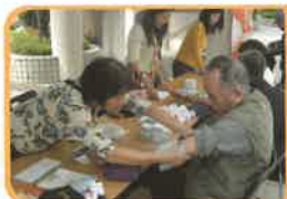
定期舉辦街展活動。