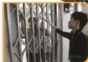
童軍知友社義工為長者油鐵閘

圓玄學院應香港房屋協會的邀請，以合約形式為居於觀塘花園大廈長者住屋的住客提供服務，並於2012年4月1日，正式投入服務。