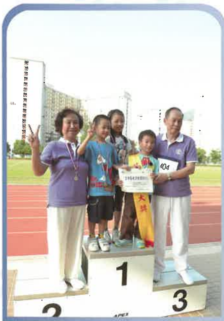
長者充滿活力，在比賽中屢創佳績。能夠破紀錄，家人的支持少不了呢！