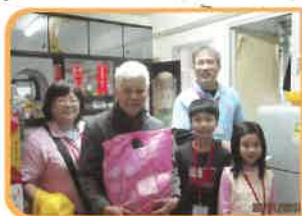
土木工程拓展處義工 到戶探訪長者及派禮物包