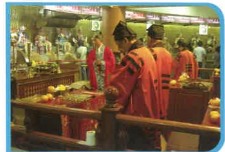
道長、經生每年為吉祥物祈福、頌經。