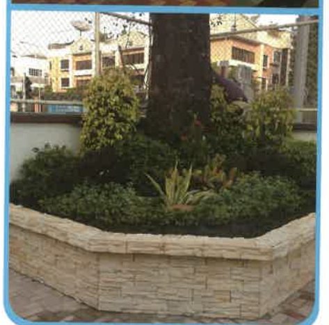
九龍真光中學(小學部)