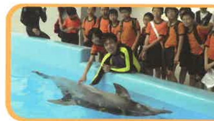
學生正參與校本課後支援計劃中親親小動物活動。能夠親身接觸海豚，他們均表現興奮。