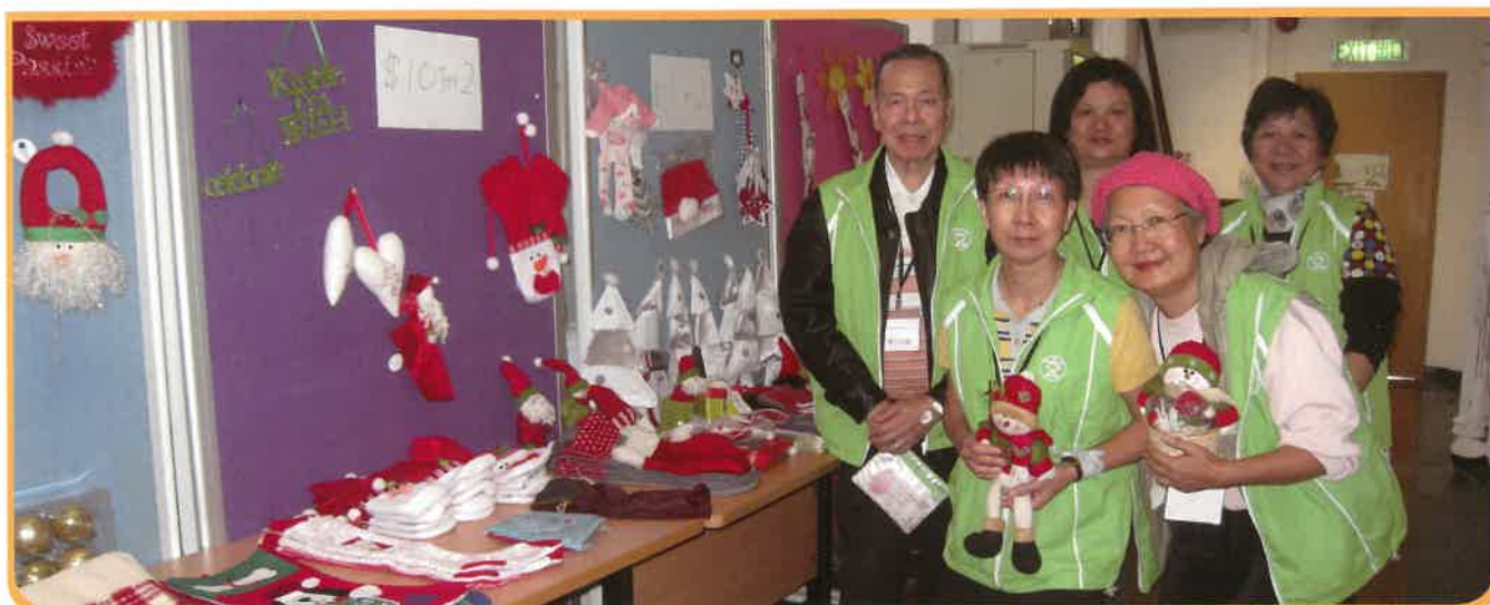
圖玄軒義工隊協助中心籌辦「聖誕慈善義賣日」