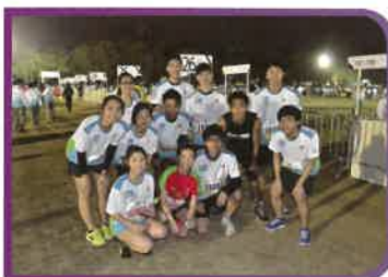
師生一同參與「渣打馬拉松2013」，同享運動的樂趣。