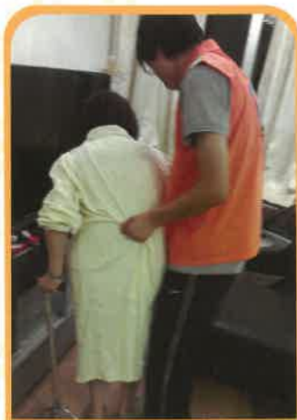
上門物理治療服務