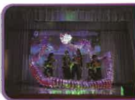
學校的龍隊在遊藝匯演中有十分精彩的表演