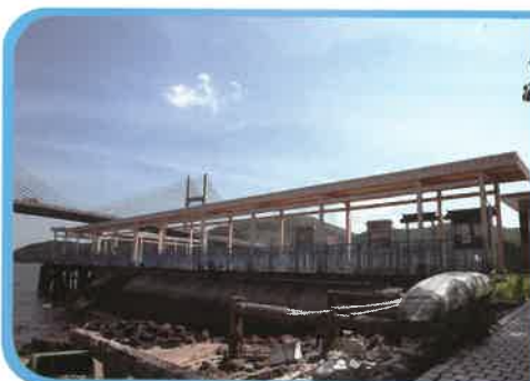
馬灣沿馬灣街渡碼頭（舊碼頭）