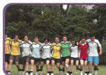
本校學生為「小母牛」作慈善籌款