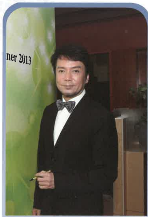
影視紅星賈思樂先生為活動擔任司儀