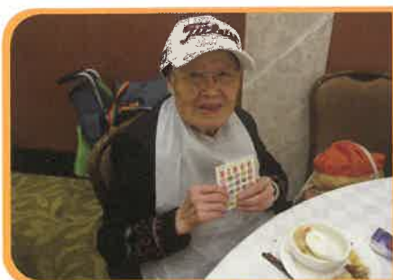
BINGO究竟有多好玩？看看這位婆婆愉快的笑容就知道啦。