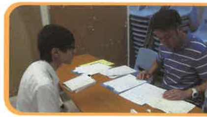
模擬放榜的活動有助學生為升學就業作為準備。