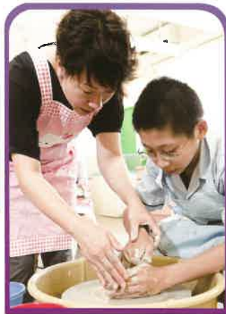
老師在視藝課教同學們製作陶藝作品