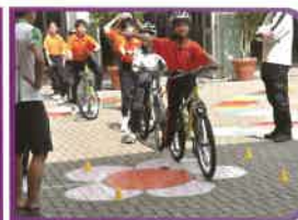
交通安全隊隊員學習安全踏單車