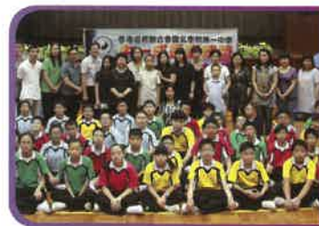
「中一成長訓練營」鼓勵學生建立自信