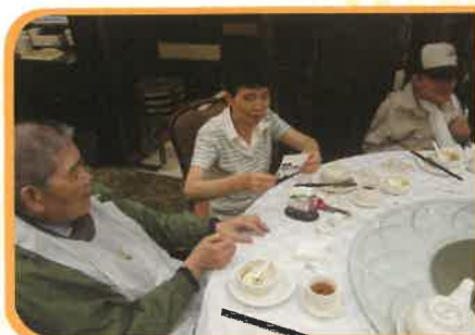
老友記和同事正在酒樓享用點心。