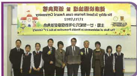
本校榮獲「健康校園金獎」