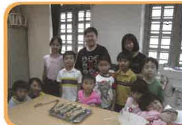
國畫書法班，小朋友的作品精彩無比！