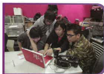
自主學習讓學生尋找學習樂趣