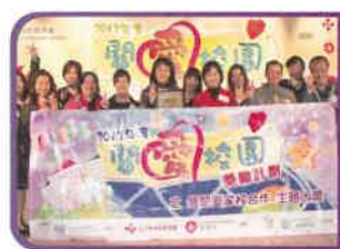
卓越關愛校園 最關愛家校合作主題大獎