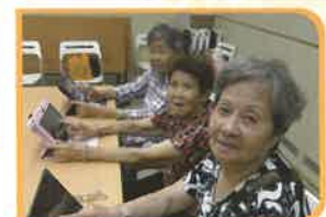
玩I Pad並唔係後生仔既專利！

中心第十三次勇奪全港長者運動會全場總冠軍，真係可喜可賀！讓長者學習欣賞自己的貢獻。