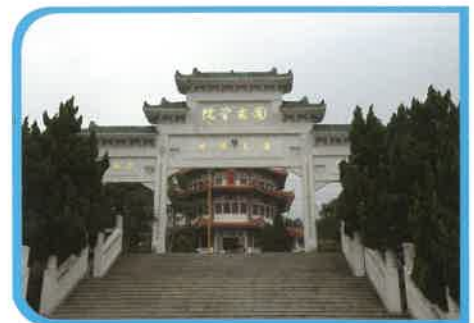
圖為院前三教牌坊，從廣場步往入德之門拾級而上便是「元辰殿」