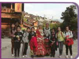
學生們跳出教室，到貴州作境外交流，學習中國傳統文化