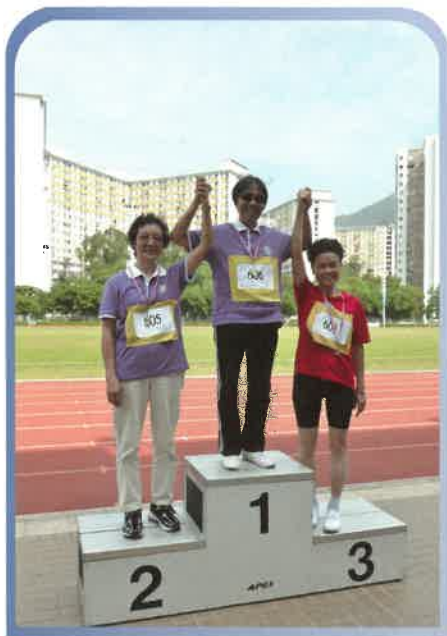
現『友誼第一，比賽第二』的精神！

自1998年至今，圓玄學院社會服務部在全港長者運動會一共勇奪十三次全場總冠軍，三次全場總亞軍，獲獎項目多不勝數，累積獎牌數目超過300面。比賽氣氛熱烈，每位參賽長者都發揮自己的潛能和毅力，爭取佳績。能在運動場上揚威，除了賽前練習外，能保持做運動習慣，亦是要訣之一。雖然，全港長者運動會已於2012年最後一次舉辦，但本部將會延續其任務，舉辦更多健體及運動班組，令長者保持個人健康體魄，鼓勵長者過一個健康模式的生活。將來，希望長者們繼續有機會在運動場上發熱發光！