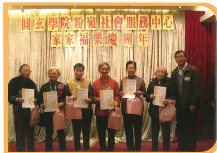
在團年飯活動中，表揚一群熱心服務的義工。