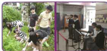
明辨是非，增強抗逆能力；關心 社會，珍惜生命