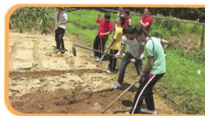
學生正參與校本課後支援計劃(區本)-有機農耕活動，體驗農夫的生活