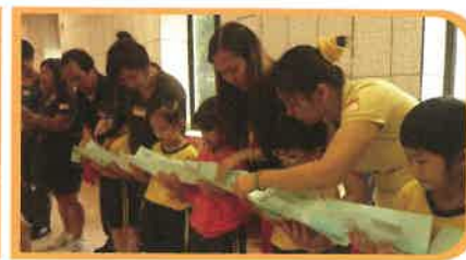
學生與家長參加親子活動，充份體現親子合作精神。