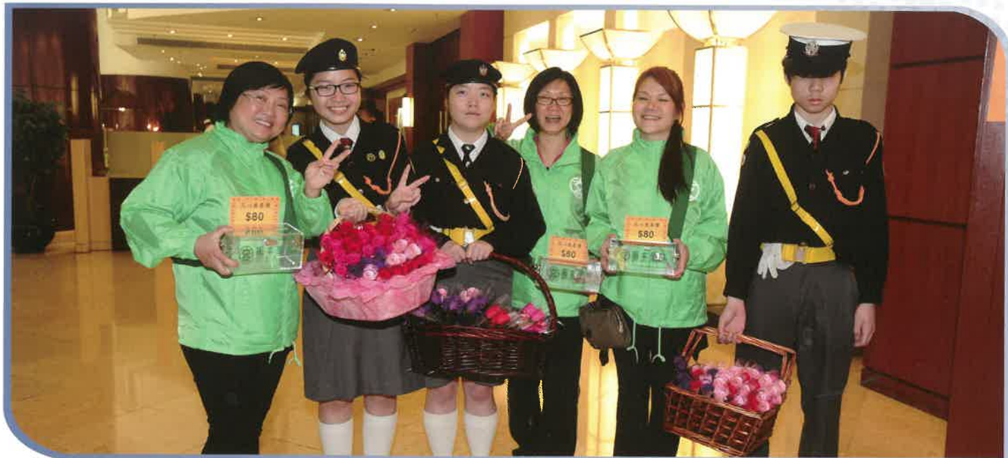
香港道教聯合會圓玄學院第一中學派出交通安全隊及圓玄軒婦女中心派出婦女義工於會場內落力義賣