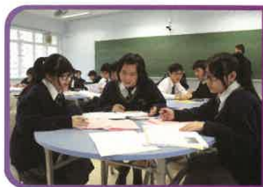
自主學習讓學生尋找學習樂趣

圓玄一中深信每位學生皆可成才。年青人都有自己獨特的個性和品賦，只要能讓他們肯定自我價值，發揮潛能，自然可在不同的領域取得成功。所以我們會通過多元化的教學法和靈活的校本課程，協助學生尋找學習的樂趣。同時，我們更會強調自學習慣的培養，讓學生找到令自己進步的方法，朝着目標穩步前進。品德培養是全人教育最重要的一環，故此我們在校內積極提倡關愛文化，提升學生的自尊感；對外則鼓勵學生關心社群，熱心服務。希望通過幫助他人，能夠令學生體會到仁人愛物的重要。