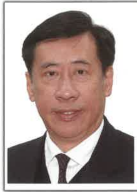
主席 陳國超博士MH JP