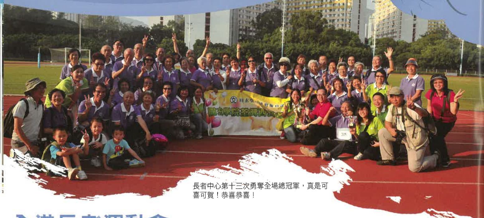
長者中心第十三次勇奪全場總冠軍，真是可喜可賀！恭喜恭喜！