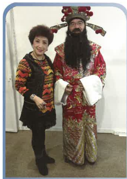
歡渡新春佳節，又點少得財神派利是呢？

每年的聯合春茗活動有多個團體參與，筵開過百席，中心每年都有超過180位長者參加呢！