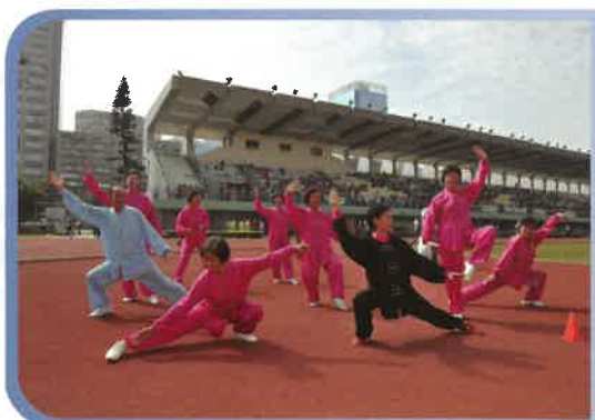
本中心的太極團體隊伍，於比賽中奪得亞軍！睇下佢地果然有姿勢，有實際！