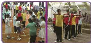
認識自己，發揮個人潛能；凝聚 力量提升歸屬感