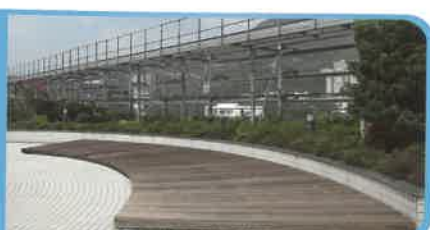
教育局 - 九龍塘 教育服務中心

地址：新界荃灣三疊潭圓玄學院西醫診療所 電話：24934600 傳真：30129929 電郵：greenwealth@yuenyuen.org.hk 網址：http://www.greenwealth.org.hk