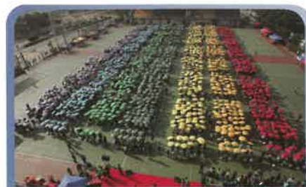
全場2,500名參加者一同撐起彩虹傘,砌成一道七色彩虹。