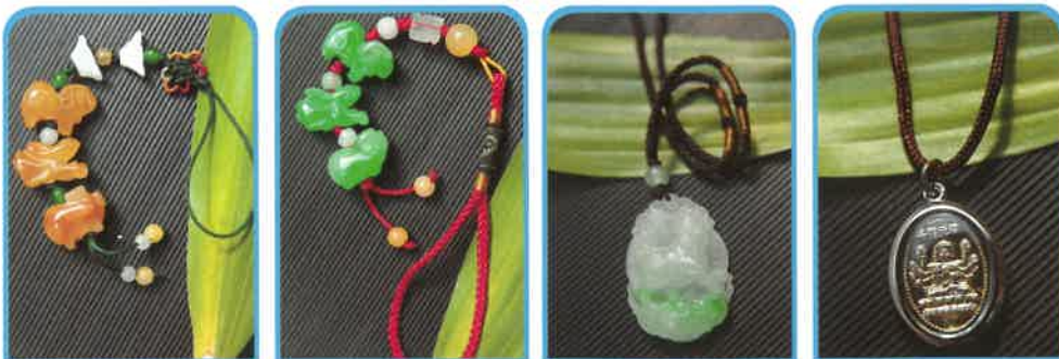
吉祥物按年編纂，由不同生肖組成。