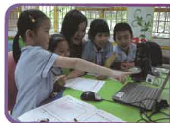
一年級同學正在課堂上展現探究精神。

「石小」近年在老師、家長的努力下，整體成績猛進，升中派位又有美滿的成績，我們期望學生除了學校生活過得充實及多采多姿外，亦能學會「追求卓越·日新又新」。