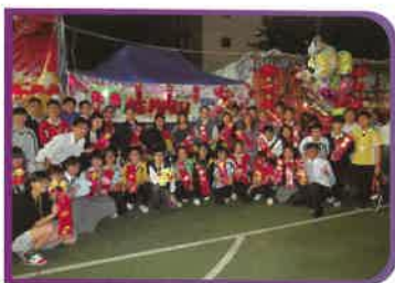
參加競投元宵花市活動，實踐商業經營和管理。