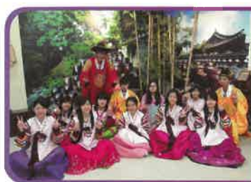
「韓國藝術文化交流團」讓學生擴闊視野，增進生活體驗。