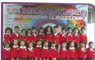
高班學生參加2013全港幼兒英文歌唱比賽在初賽組獲得冠軍