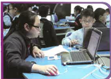
本校獲教育局撥款推行中國語文科電子學習計劃，透過電子學習平台，提升學生學習效能