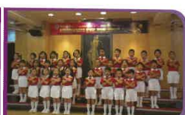
2013年度高班學生參加香港道教聯合會屬學校道德經朗誦比賽獲得幼稚園組亞軍