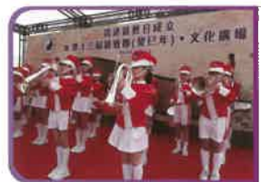
我們步操管樂隊於第十三屆道教節文化廣場中表演