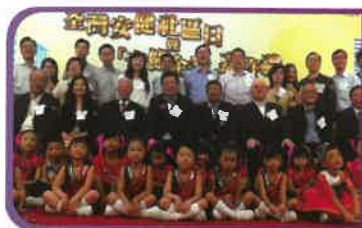
高班學生參與2013年荃灣安健社區日嘉年華表演並與眾嘉賓大合照