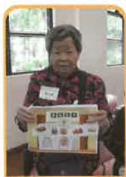
為自己設計靈堂佈置都百無禁忌！