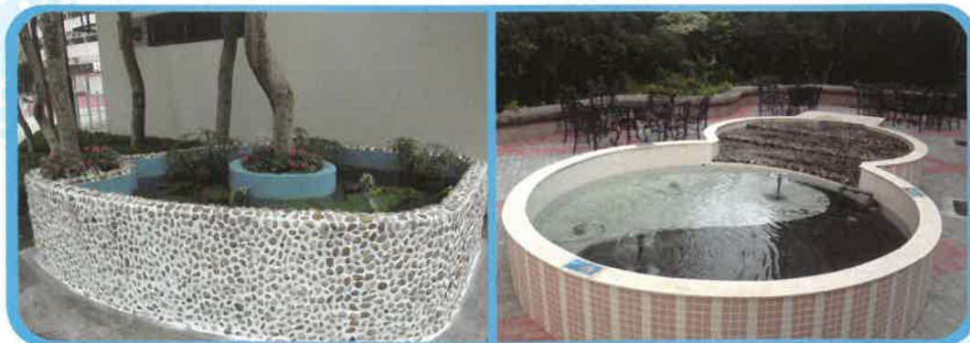
梁文燕紀念中學 (沙田)