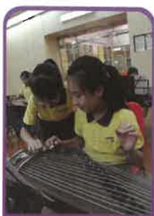
小休時，古箏組的同學仍把握機會，互相切磋。