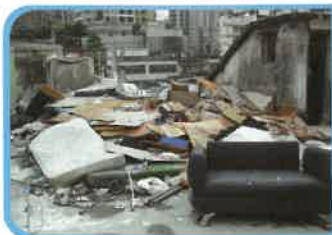
承辦民政署樓宇清潔計劃