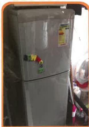
緊急添置計劃由善長捐出傢俱，如雪櫃和床，以解燃眉之急。

緊急添置計劃為有需要之人士提供即時性物資供應。本社會定期安排家訪，了解受助者的困難及可提供的支援，解決迫切的需要。