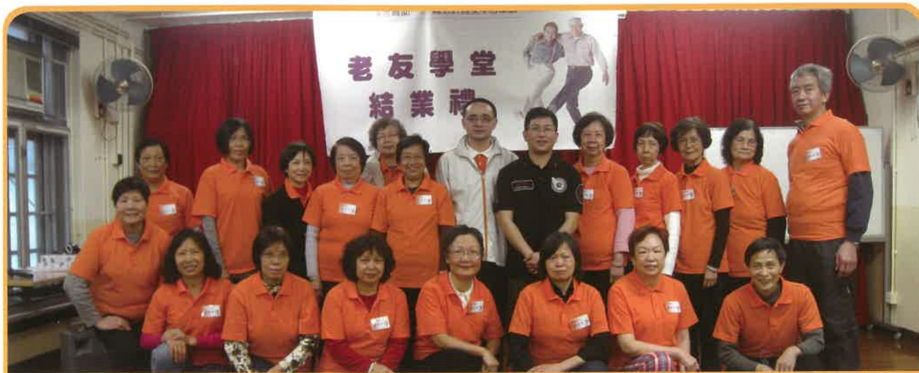
區議會撥款活動「老友學堂」結業禮