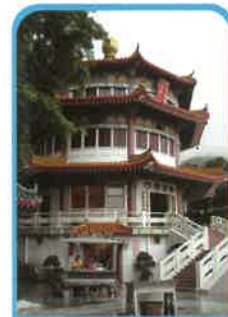
三教大殿底層為「元辰殿」