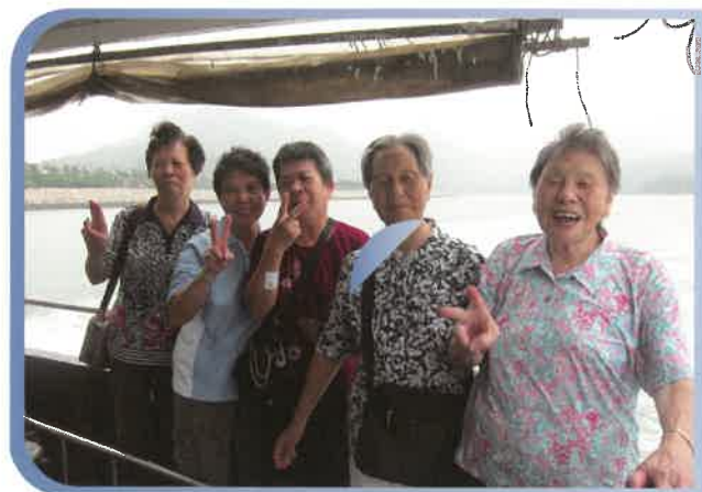
一班老友記開心參加遊船

中心積極申請不同基金以提供各項服務予區內長者及居民，當中去年曾申請區議會撥款舉辦『道路安全日營』、『碧波暢遊慶回歸十五週年』及『圓玄粵韻慶回歸』活動。