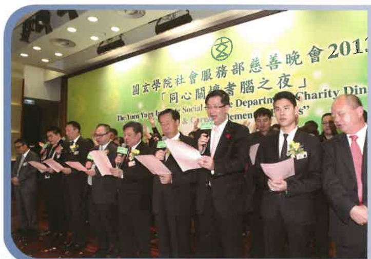
為答謝到場人士熱烈支持，董事會成員帶領社會服務部同事合唱「圖玄之歌」以表謝意