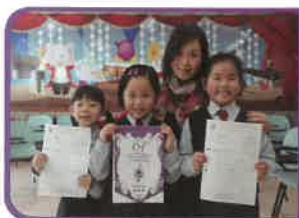
學校朗誦節囊括冠、亞、季軍。