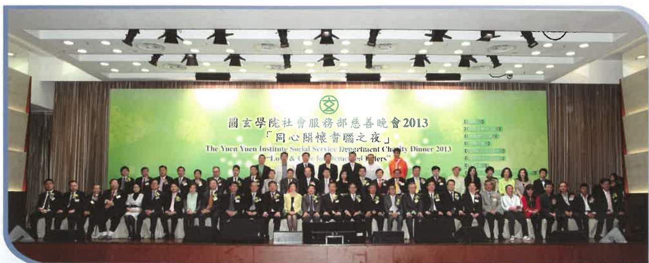
籌備委員會成員與董事會成員及主賓合照