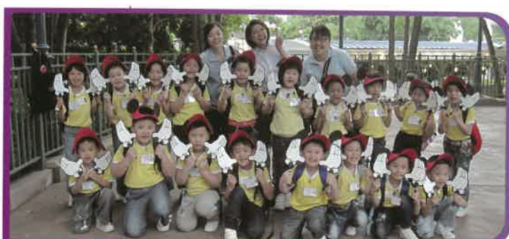
高班學生參加畢業旅行活動，與老師一起暢遊「香港迪士尼樂園」，渡過愉快的一天。