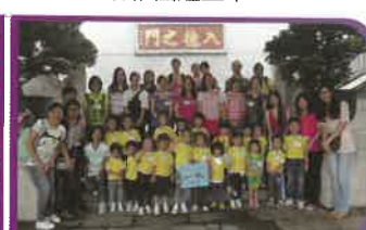
義工家長與學生參觀圓玄學院及品嚐齋宴。