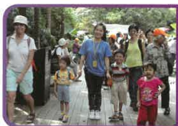
本校暖流義工團服務社區，學會助人自助。