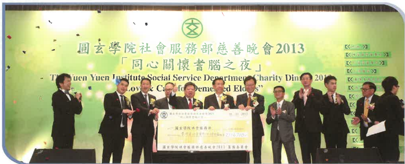
整晚活動共籌得慈款$2,316,710，感謝各界全力支持