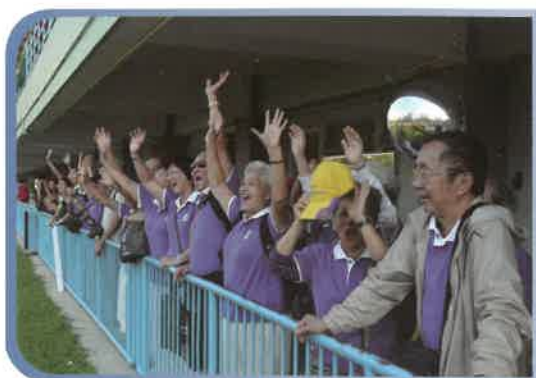
宣布團體賽果的一刻，睇下佢地幾興奮！