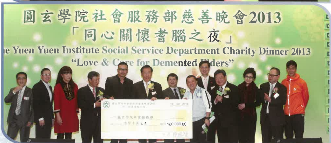
星級遊戲“認知障礙症”問答大賽由主席團及名人分組參加，帶動全場投入，賓客從遊戲中更可知深了解認知障礙之成因及特徵