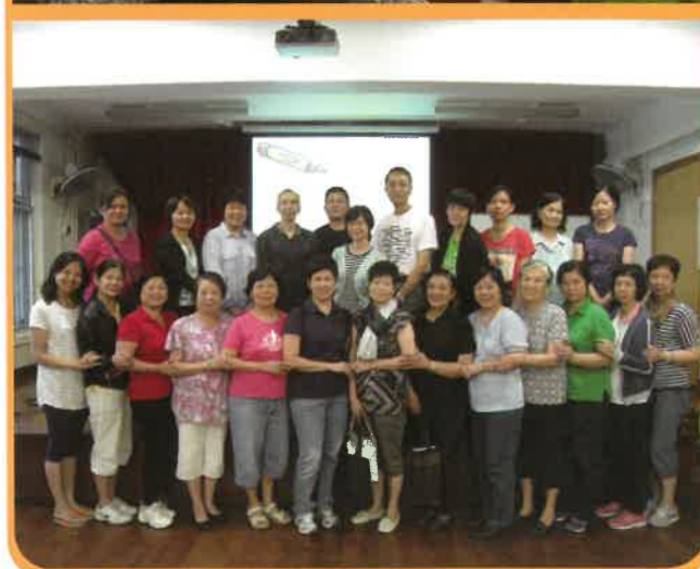
義工工作坊及團隊精神訓練