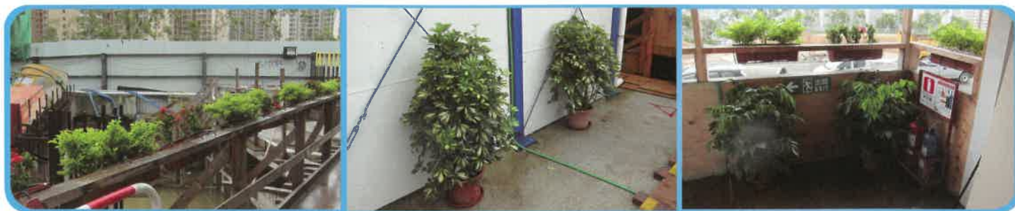
新昌營造廠有限公司 - 安達臣道D區地盤