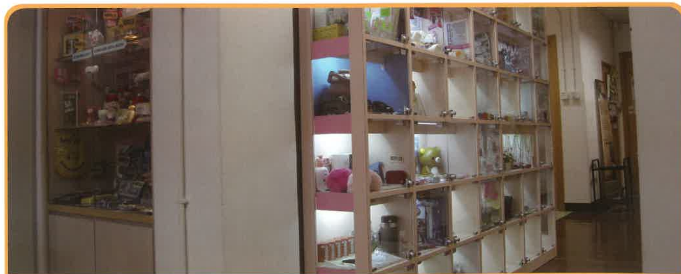
中心設有姿彩百貨精品專區(左)，及租借格仔舖(右)予會員一嘗做老闆的滋味!