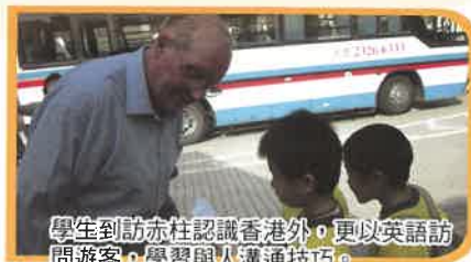
學生到訪赤柱認識香港外，更以英語訪問遊客，學習與人溝通技巧。