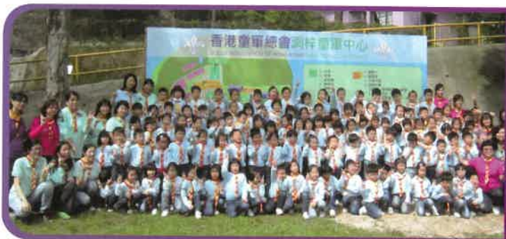
聯校小童軍日營-洞梓童軍中心