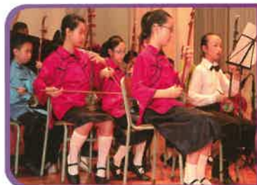
中樂組同學在台上奏出悠揚的樂韻。