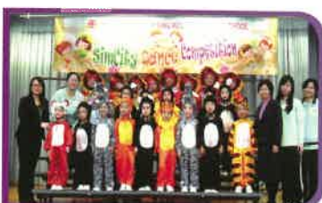
高班學生代表參加區內小學舉辦(SimCity)舞蹈比賽獲得優異獎