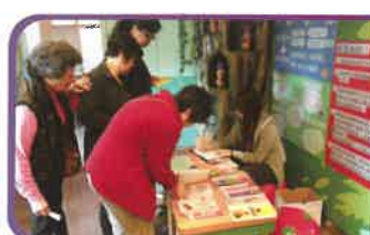
家長借閱圖書服務