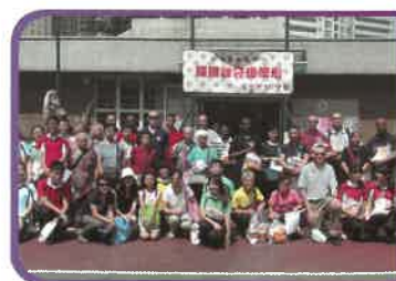
本校學生為來港美國海軍於「耀陽福袋暖萬心」活動中作英粵語即時傳譯服務