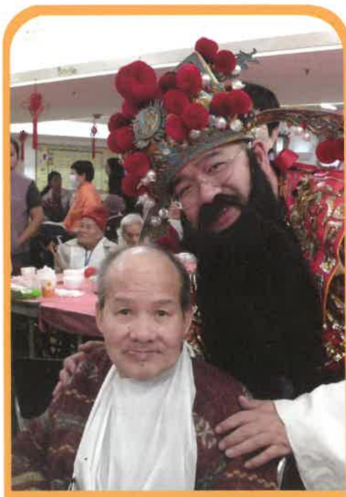
與財神合照，今年一定行大運！

是次活動於鑽石山荷里活廣場舉行，院友首先於酒樓品嚐美味點心後，再在職員及義工的陪同下，於商場及超級市場內閒逛。在超市裡，院友更可以購買自己喜愛的小食及飲品，享受親自購物的樂趣。活動過後，院友們都對於能夠有機會遊覽及見識院舍以外的地方增廣見聞，增添生活情趣，心情感到十分興奮。而整個活動過程當中，更有義工們陪同院友一起暢叙，讓院友感受到來自熱心人士的關懷。