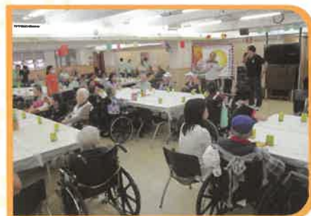
院友和家屬們正在聚精會神聽義工表演唱歌呢！