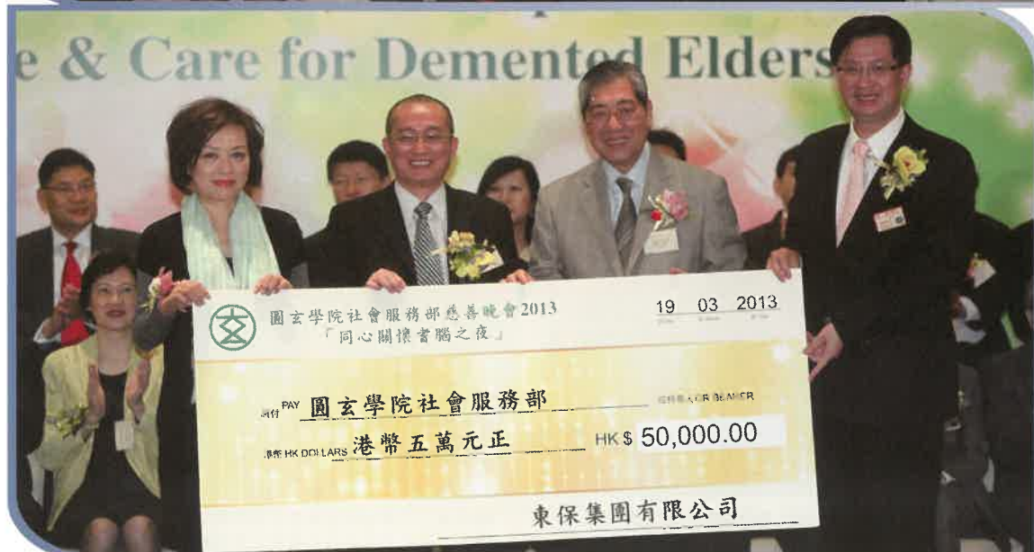
仁愛堂以及東保集團分別捐出5萬元成為明珠贊助