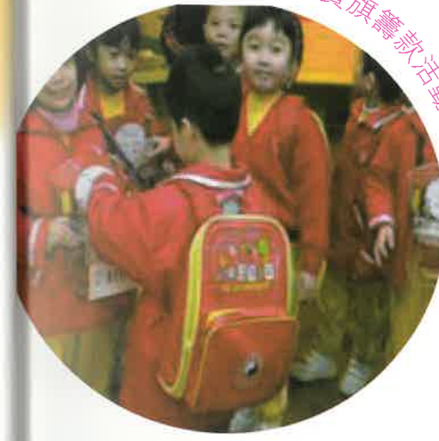
幼兒積極參與賣旗籌款活動

除了參與區內活動外，會屬幼稚園的學生亦積極參與公益活動。例如每年幼兒積極響應圓玄學院舉辦的「賣旗籌款」校內募捐活動，並將所得的善款作為強化長者、學校及弱勢社群的支援工作。除此之外，各幼稚園均有「一人一利是」的籌款活動，以幼兒捐出的利是錢來推動「敬老愛老」的精神，從而培養幼兒敬老的美德，讓幼兒學會關懷別人及懂得分享的意義，共同建設一個關懷長者的社區。