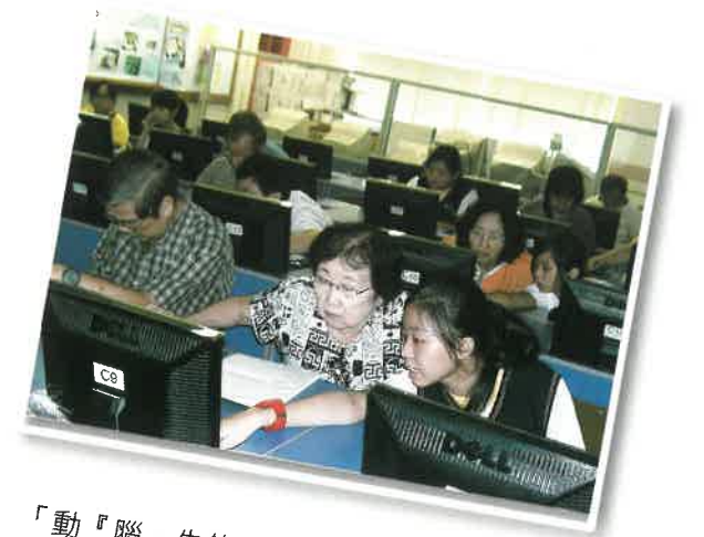
「動『腦』先鋒」電腦班---同學細心協助長者運用電腦軟件製作圖畫。

本學苑開辦的課程特色，以提升長者的生活素質，幫助長者妥善規劃其退休生活，與時並進，增添活力，加強自信為目的。課程包括資訊科技（電腦應用）、音樂、保健、才藝等，發展長者個人不同的興趣及潛能，豐盛人生。此外，透過參加課程，鼓勵長者與青少年學生加強相互了解及接觸，達致互相學習、互相欣賞，跨代共融的目標。