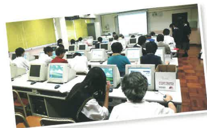
長者學習電腦的情況。