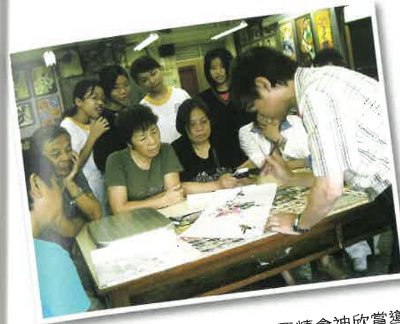
「書墨耆緣」書畫班一學員聚精會神欣賞導師示範畫畫的技巧。