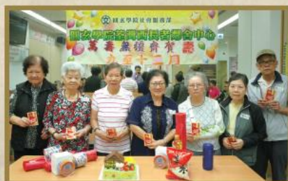
本中心每季均會舉辦「萬壽無疆生日會」，為會員慶祝生辰。是年有賴諮詢委員會贊助，每位生日會員於活動中更獲贈紅包一封。