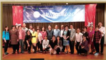
北區區議會贊助「花好月圓暖萬心 2016」演出者合照。