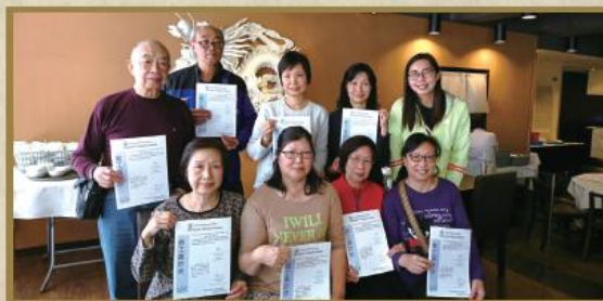
本社八位默默付出的義工們，感謝他們的努力。