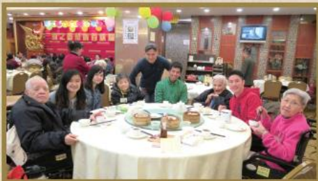
香港消防義工隊陪同院友品茗。