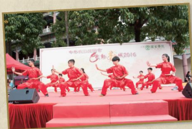
中華武術耀圓玄 - 武動『荃』城 2016