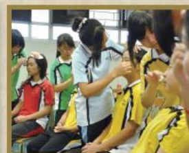
學生正參與「校本課後支援計劃（區本）——化妝師初探」。