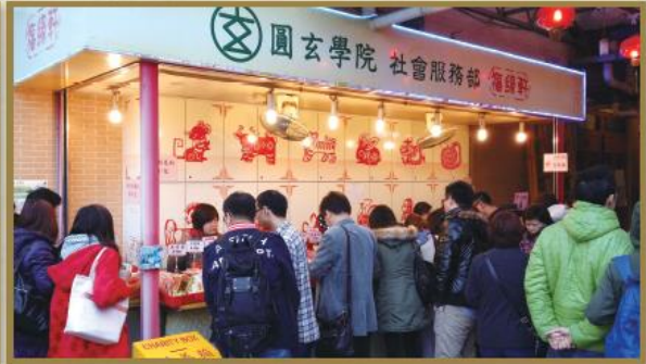
農曆新年期間，置於福緣軒門外之新春義賣檔攤人頭湧湧。