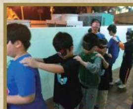
學生參與「成長的天空再戰營會——挑戰夜行活動」。