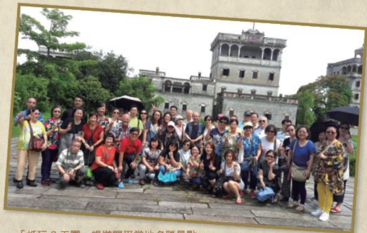
「抵玩 2 天團」暢遊開平當地名勝景點。