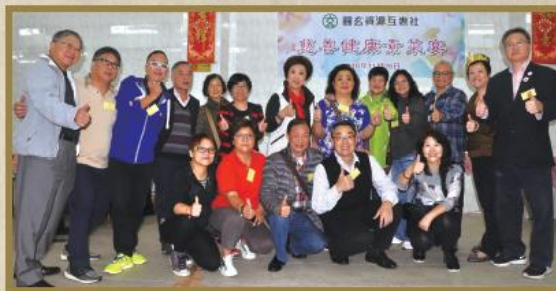
「健康慈善素菜宴 2016」：感謝委員們及義工們的鼎力支持及協助，使活動得以順利並圓滿地完成。