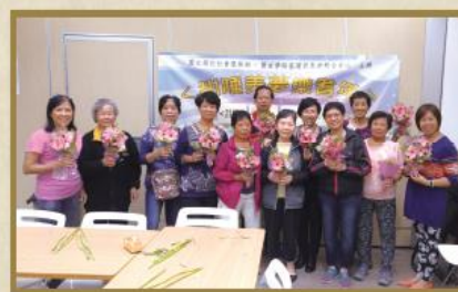
「甜美美夢樂耆年」計劃舉辦插花小組，幫助有睡眠問題的會員透過活動輕鬆減壓。

有幸得到匯豐基金贊助，本中心將舉辦名為「桌上同遊樂頤年」計劃。桌上遊戲（簡稱「桌遊」）雖隨時代變遷而不斷演化，但不論老幼都能從中得到歡樂和友誼。是次計劃透過「桌遊」凝聚社區中的長者、護老者及社區人士，以推廣積極樂頤年的訊息，同時鼓勵長者走進社區建立支援網絡。計劃亦邀請年輕退休人士成為「棋玩大使」，讓他們到訪區內各弱勢長者家中，與長者進行「桌遊」，以發揮義工力量，向社區中的長者展現關顧之情。