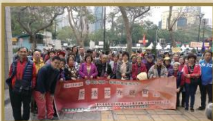
中心長者會員參觀回歸二十週年活動「香港花卉展覽」。