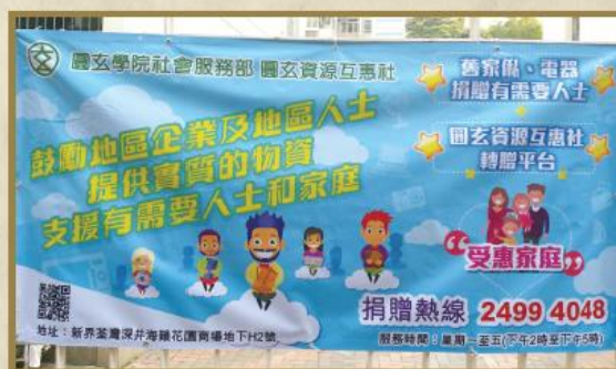
在社區懸掛本社橫額以作宣傳，呼籲街坊為有需要人士捐獻二手傢電。