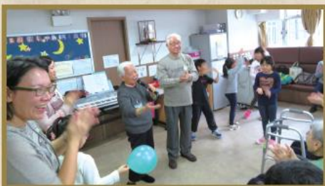
神昭會義工與長者一起高歌。