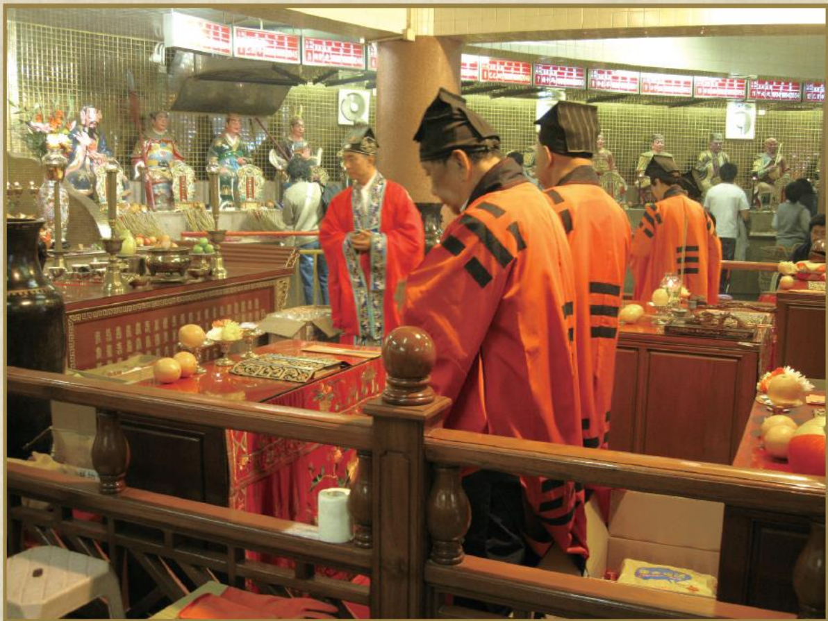
道長、經生每年均為吉祥物祈福、誦經。