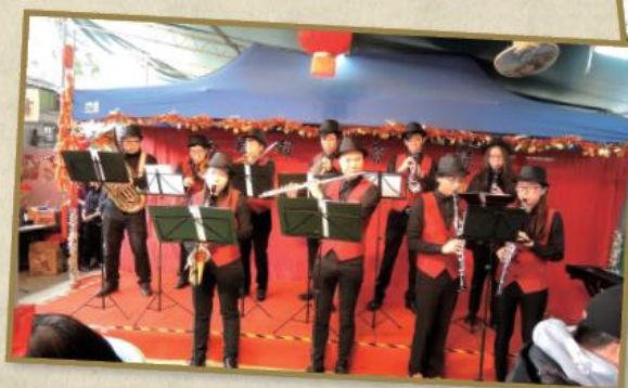
銀樂隊氣宇軒昂，步操及演奏時好不威風。