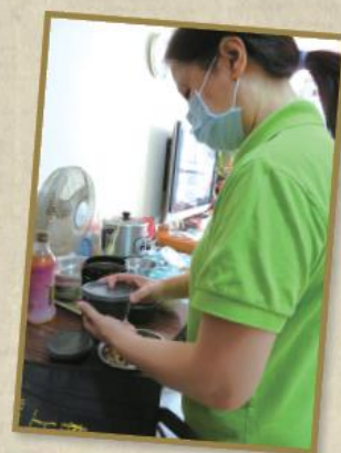
送飯服務 為長者提供上門飯餐派送服務，讓長者在在家中都能得到膳食的支援。