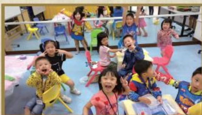
兒童暑期活動的小朋友玩得盡興。