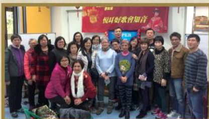
北區區議會贊助「賞曲迎春會知音 2017」。