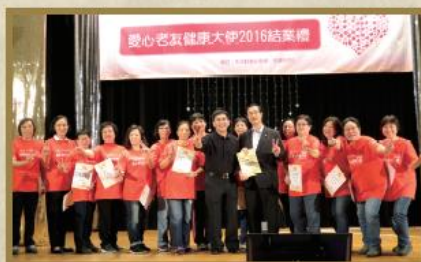
「愛心老友健康大使 2016」結業典禮。