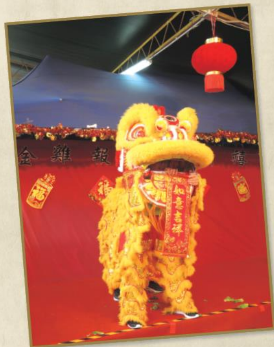
護理部職員的醒獅表演，將醒獅舞得生動及醒目。

在慶祝節日的同時，一眾參加者不忘行善最樂，踴躍購買「圓玄慈善券」及惠顧「圓願以償」之祈願牌，並在拍賣環節熱烈競投，使活動更富意義。