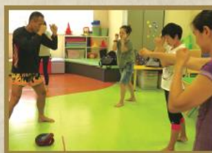
導師與學員齊齊練習出拳。