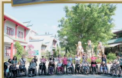
院舍定期舉行大型旅行，家屬和院友共同暢遊雲泉仙館、慈山寺及迪士尼，甚為歡欣。兩次旅行共有五十位家屬及院友參加，活動當日彼此樂也融融。