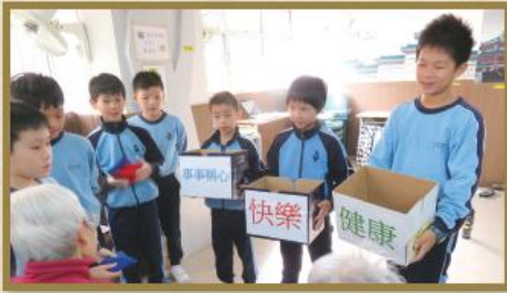
小學生與院友遊戲樂。

「長者院舍住宿服務券（院舍券）試驗計劃」是一項由社會福利署推出的安老服務新措施，採用「錢跟人走」的原則，為有需要長者提供一個選擇，讓其可選擇接受認可服務機構提供院舍照顧服務。本院於 2017 年 3 月成為院舍券認可服務機構，服務對象乃是經社會福利署之「安老服務統一評估機制」評定為身體機能中度缺損及正在長期護理服務中央輪候冊中輪候護理安老宿位的長者。如有查詢，歡迎致電 2422 1681。