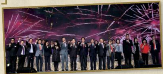
全體主禮嘉賓與在場 1,700 多位長者祝酒，祝願大家身體健康、萬事如意。

「傑義風采喜迎春 2017」聯合春茗活動由三個慈善機構，包括圓玄學院、博愛醫院及仁愛堂攜手合辦。藉著舉辦聯合春茗，三會董事局成員與在場長者一同慶祝雞年來臨，並歡度新春佳節。當日場內筵開接近150席，參與活動的長者更超過1,600人，場面相當熱鬧。除有精彩豐富表演節目之餘，大會更邀請到安老事務委員會長者學苑發展基金委員會主席梁智鴻大紫荊勳賢 GBS, OEB, JP、安老事務委員會主席林正財太平紳士，BBS 及中央人民政府駐港聯絡辦公室新界工作部張肖鷹副部長為三個機構的義工作嘉許，以表揚他們無私奉獻的精神。