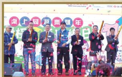
「桌上同遊樂頤年」計劃於 2016 年年尾舉行嘉年華作揭幕禮，當日除了各項精彩絕倫的表演節目外，亦有多個趣味攤位。