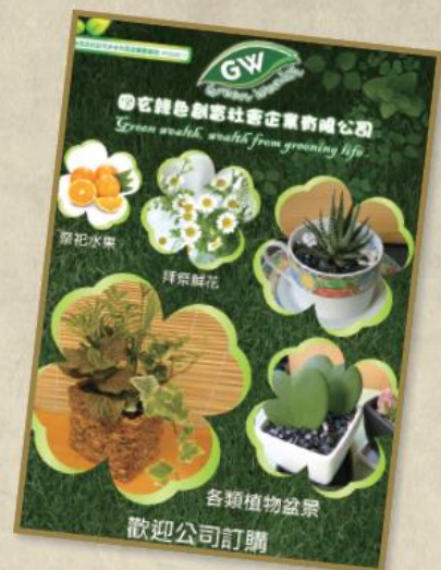
各類型水果、鮮花及植物盆景