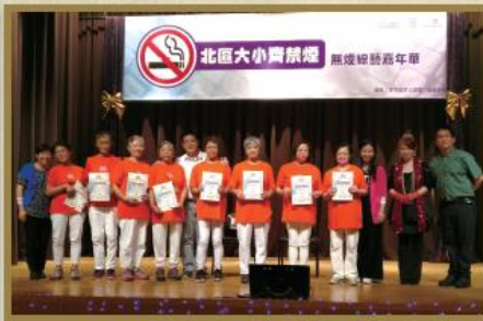
「北區大小齊禁煙」無煙大使嘉許典禮。