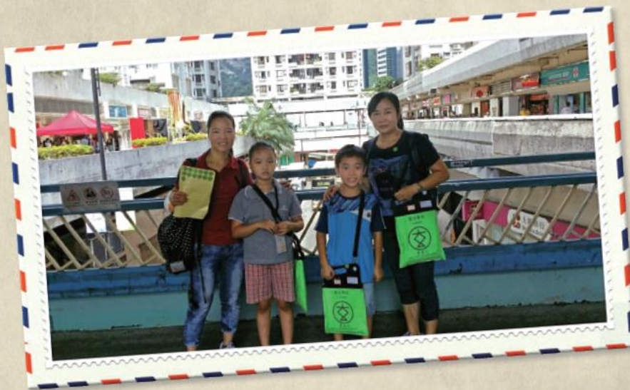
本部員工對機構傾力支持，帶同親友、子女一起參與賣旗，此舉實屬難能可貴，在此向他們表達由衷謝意。

圓玄學院社會服務部於 2016 年 9 月 24 日舉行新界區賣旗日，感謝來自學校、社會服務機構、義工組織、本部服務使用者、員工、家長及個別公眾人士支持，是次活動共邀得接近 1,700 位義工於新界區協助本部賣旗。整項賣旗籌款（包括賣旗、籌款箱及金旗募捐信）合共籌得善款港幣 $532,665.75 元。籌得之善款將會用於長者合約院舍的營運經費。本部謹代表服務受眾，衷心多謝各界人士鼎力支持及慷慨捐款。