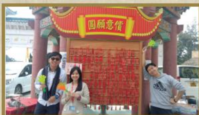
本年度新春慈善義賣增設「圓願意償」祈福區，善信可以將自己的心願寫上祈願牌，然後掛於祈願區上，別具一番新意。

每年新春佳節，圓玄學院社會服務部都會舉行新春慈善義賣，今年賀年義賣飾品十分精緻及別具特色。有賴義工們的努力及善長支持，今年貨品都非常暢銷。本部所籌得善款收益將發展長者、婦女及兒童服務，並為社區弱勢群體支援服務之用。