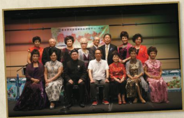
「圓玄粵韻迎中秋」活動，讓一眾粵曲班同學能發展所長。

透過舉辦粵曲文藝表演活動「圓玄粵韻迎中秋」，藉悅耳動聽的傳統中樂曲與區內的居民及長者一同歡度中秋節，為荃灣社區帶來溫馨和睦的節日氣氛。