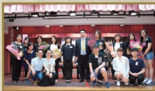
學員向院舍導師獻花，以答謝導師多年來的教導。

「青航計劃」體現到官、商、民間的合作無間。計劃亦籌辦了嘉許禮，以嘉許一群用心及堅持服務長者的年青人，以及感謝各參與計劃的院舍。因為同業的支持以及悉心的教導才可扶植一眾年青人投身安老服務業，致使護理安老服務業繼續有年青新血加入，延續「愛老、護老、敬老」的使命。