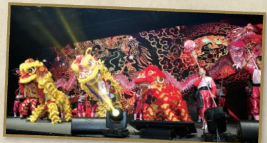
三頭醒獅及一頭金龍聯手表演，為聯合春茗聚餐揭開序幕，龍騰虎躍的表演全由長者負責，令人讚嘆不已。