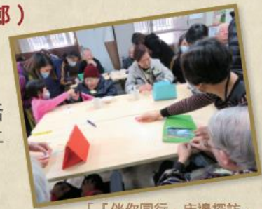
「『伴你同行』床邊探訪」

三十多名來自聖若望宗徒堂的社區義工探訪全院長者，包括入房探望臥床長者；除了慰問長者並與其傾談外，他們亦送上親手製作的相架，令長者感受到無限關懷。