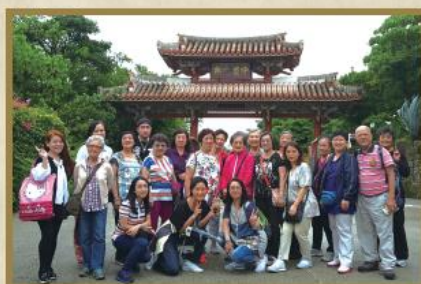
會員們在「日本沖繩五天團」留影。