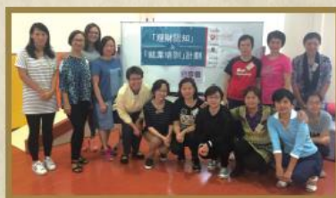
婦女們自強不息，終生學習！