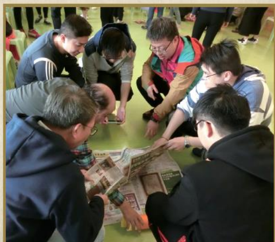
教師正參加教師工作坊——合力完成「砌高塔」活動。