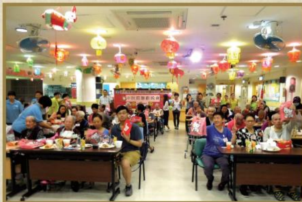
中秋慶月笑盈盈，家人共聚樂悠悠。