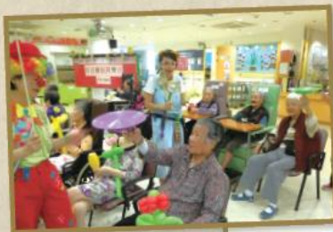
「一指神功」，長者玩得出神入化。