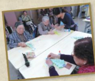
聖誕樂繽紛 藉住聖誕來臨，職員與長者攜手製作聖誕樹，以增加日間中心節日氣氛。