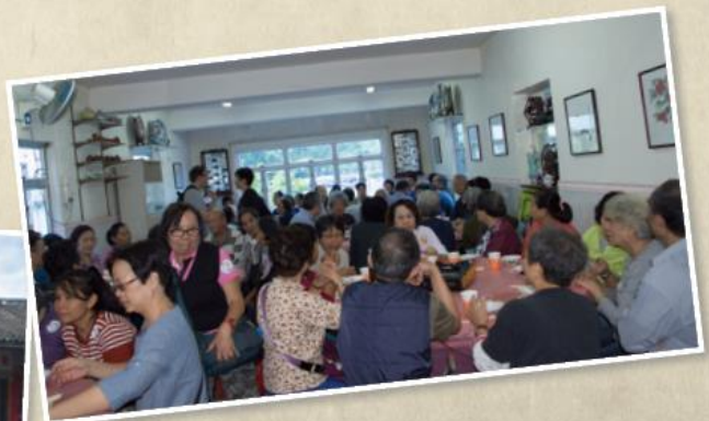
300多人一同參觀新界客家圍籠屋（屏山文物徑上璋圍）、恆香老婆餅製造工場及蓬瀛仙館等地方，並享用屏山盆菜宴。