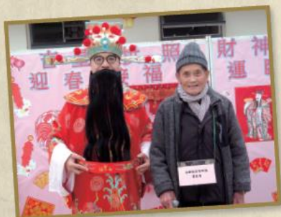
院友義工進行「圓玄慈善券」及祈願牌義賣時，不忘沾沾財氣，與財神合照。