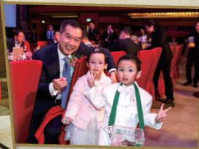
圓玄幼稚園愛心小義工為慈善親力親為。