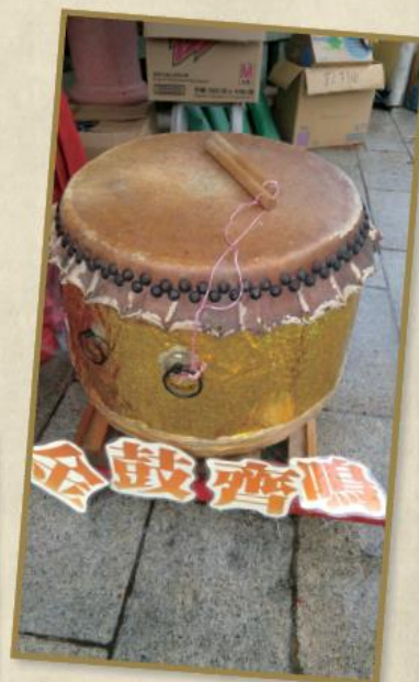
善信打過「金鼓齊鳴」，全年平平安安，身體健康！