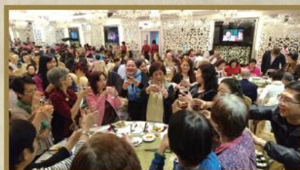
中心九週年紀念聚餐獲得會員鼎力支持。