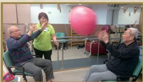
復康運動：眼明手快拋接健康球！