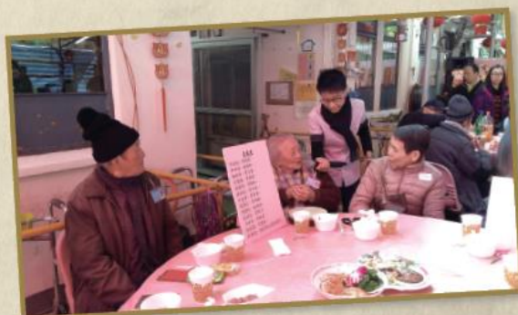
院友朗誦多首耳熟能詳的廣東打油詩，勾起彼此的共同回憶。