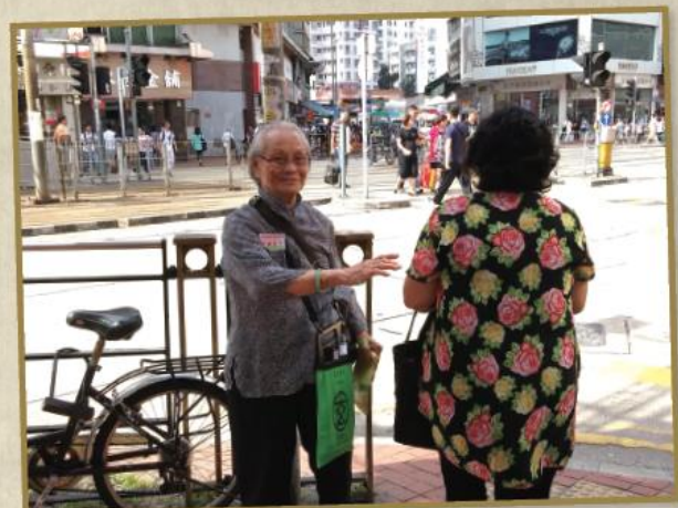
長者義工積極在街上呼籲途人買旗捐款。