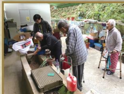
香港專業教育學院 (IVE) 的社會工作系實習學生舉辦園藝小組，讓院友們可以親自栽種草頭實寶及油菜花，提升他們的成功感及園藝手工創意感。