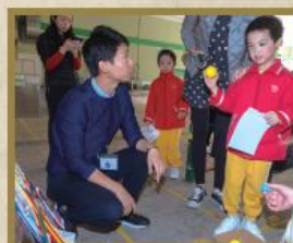
舉辦幼稚園攤位活動，學生表現得相當投入。