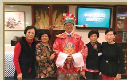
每年度之團年飯宴最受會員們歡迎，財神爺一到，參加者都喜上眉梢。