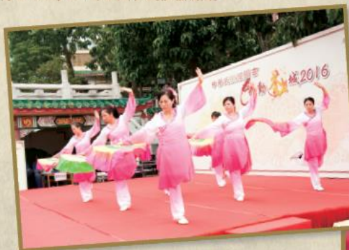
武術團體進行武術大匯演。