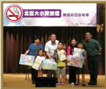
「無煙訊息兒童繪畫比賽」勝出之小朋友獲頒發獎盃及豐富獎品。

圓玄學院粉嶺社會服務中心與「香港吸煙與健康委員會」合辦的「北區大小齊禁煙」無煙社區推廣計劃，提供免費戒煙諮詢及轉介服務，無煙大使在北區各點邀請居民為有志戒煙者打氣，在留言板寫上加油字句，另外亦舉辦「無煙綜藝嘉年華」及「兒童繪畫比賽」等，為北區無煙清新社區盡一分力。