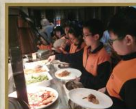
學生參與「校本課後支援營會——學習酒店餐桌禮儀」。