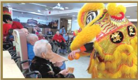
農曆新年醒獅表演，並派發禮物給院友。