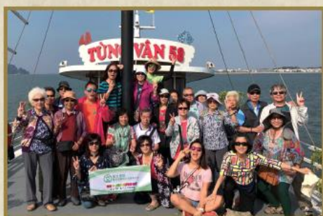
眾團友高高興興地在下龍灣上留影。