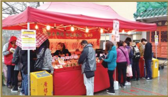
福緣軒新春義賣攤位。