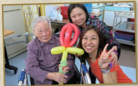
「圓玄一中家長教師會樂展關懷」家長義工們自製出別出心裁的氣球和布偶毛巾，院友收到禮物後都分外開心。

香港道教聯合會圓玄學院第一中學家長教師會的一眾義工，出心出力，為院友設計精彩又繽紛的活動，包括有扭氣球表演、教授保健操、演唱流行曲等。而且義工們更為每個院友送上精美的手工毛巾，令院友們都喜出望外。