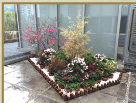
小型園藝設計及種植工程