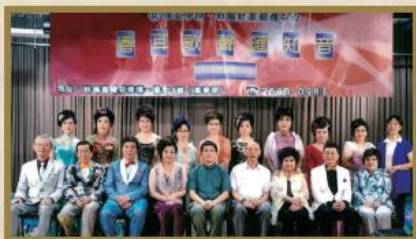
曲藝社為區內居民演出「粵耳歌聲會知音 2016」。