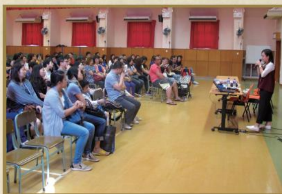
定期舉辦不同家長講座及工作坊。