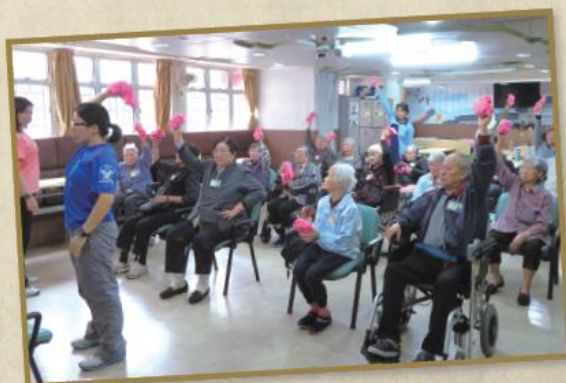
「齊來 fit 一 fit」 日間中心之長者做毛巾操運動，表現得相當投入，充滿活力。

網址：http://www.yuenyuensocialservice.org.hk