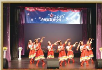
「中西區歡樂今宵 2016」大型歌舞表演。