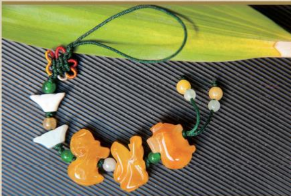
三合吉星按年編纂，由不同生肖組成。