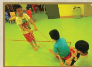
小朋友透過感統小組遊戲，訓練大小肌肉及提升合作能力。