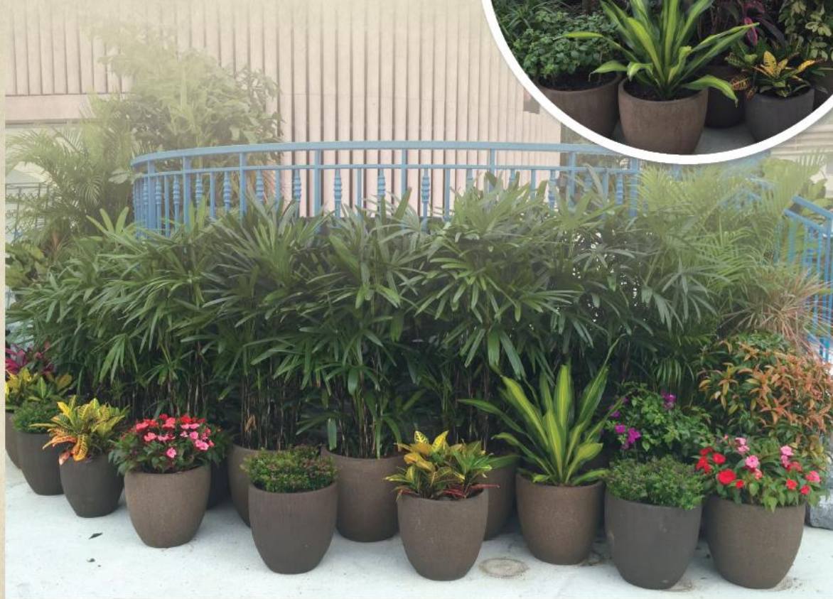
大型園藝設計及種植工程