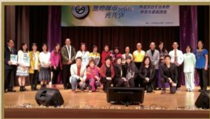
「無煙城市齊共享」無煙訊息歌唱大賽。