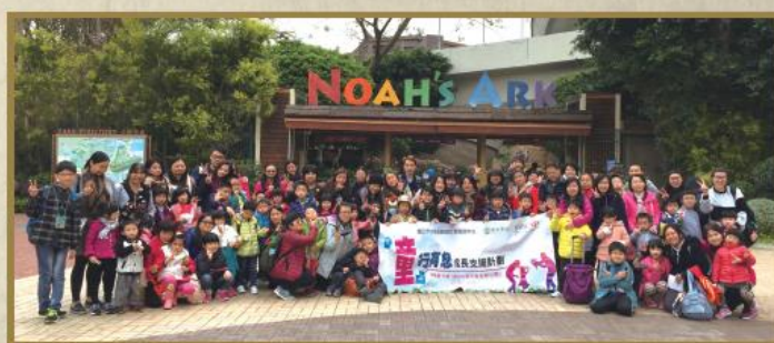
「方舟同行樂」參加者大合照。