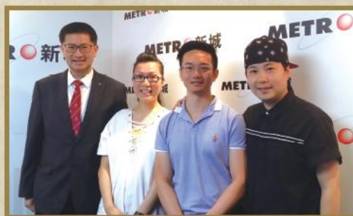
學員獲新城電台邀請出席訪問，講述在職在學的生活點滴。