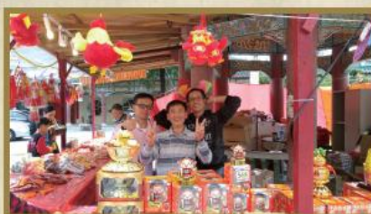
數十名勞苦功高的義工為「新春義賣 2016」作出善舉，特此致謝。