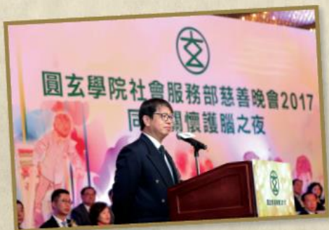
香港特別行政區（香港特區）政府 勞工及福利局前副局長蕭偉強太平紳士為晚會致辭。