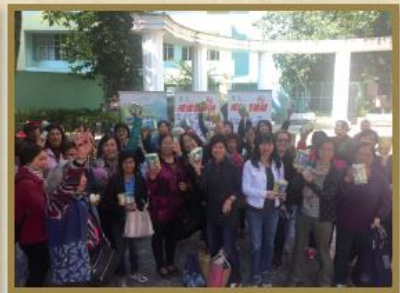
「戒煙加油站」為戒煙者打氣，並向居民大送紀念品。