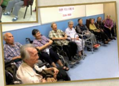
健康知識知多些，生活安康心滿意。