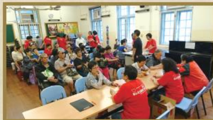
義工大使在「長者關愛日」為長者們作身體檢查及慰問。