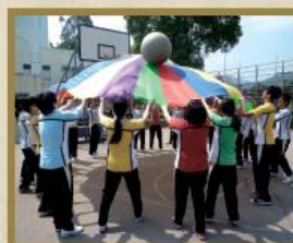
學生正挑戰訓練活動。