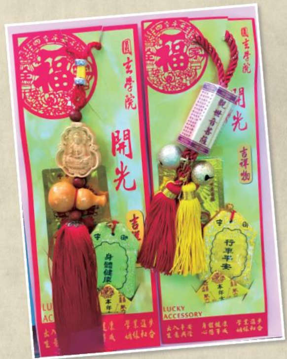
吉祥飾物包裝內附有錦袋、平安符、觀音紙卡。