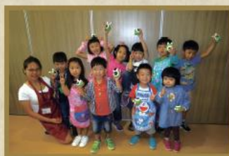
小朋友精美的黏土泥膠作品。