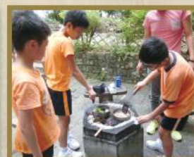
學生參與原野烹飪活動。